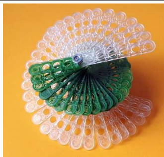
Elicoide con i suoi due cammini