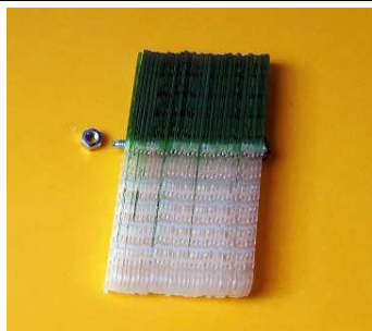
Barrette collegate da un bullone da chiudere con un dado